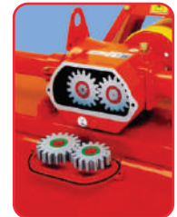
Transmisión central 4 velocidades.