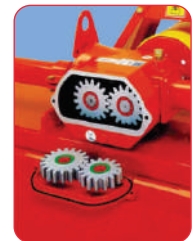
Transmisión central 4 velocidades.